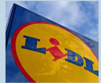
Duurzaamheid volgens Lidl